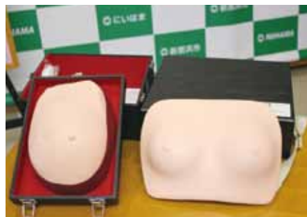
乳がん触診モデル