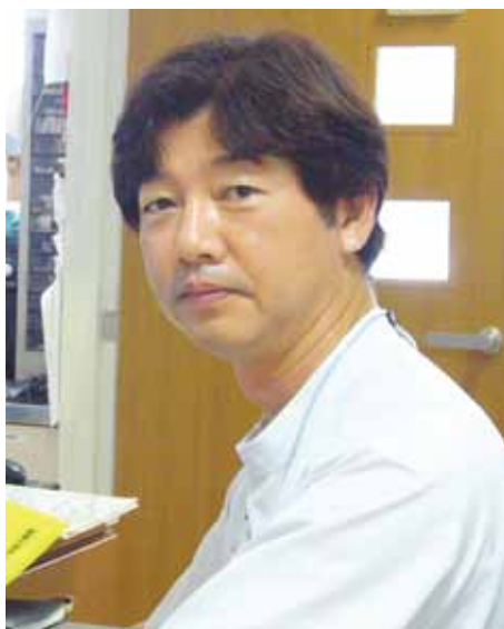
◎診察日【外科】 月・木曜日／午前8時45分～12時

胃の中には食べたものの消化を助けたり腐敗を防ぐための強い酸性の胃液が分泌されています。そのため通常の細菌は胃の中では生きていけません。ところが、ヘリコバクター・ピロリという細菌(ピロリ菌)は、このような胃の中でたくましく生息できて、胃炎、胃潰瘍、十二指腸潰瘍、ある種のリンパ腫、胃癌などを引き起こす原因の一つであることがわかっています。これは1970年代の終わりにオーストラリアの二人の医師によつて発見されました。「ヘリコ」とはらせん形を意味し「バクター」は細菌を意味します。そして「ピロリ」とは幽門という胃の出口の名称からきています。要するに胃の出口近くに住んでいるらせん菌と云うことになります。