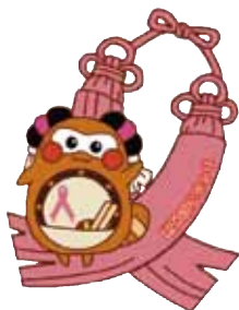
ピンクリボンまちゅり