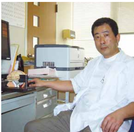
◎診察日【脳神経外科】

多くの人が一度くらは頭痛を経験したことがあると思いますが、本日はその頭痛の中でもポピュラーな片頭痛のお話をします。 頭痛には一次性頭痛と二次性頭痛があり、後者は頭痛の原因となる脳や体の異常（例えば脳腫瘍やクモ膜下出血）があり、それによって引き起こされる頭痛です。放っておいては命取りになったり、後遺症が残ったりする怖い頭痛です。 前者は放置していても命取りになったり、後遺症が残ったりすることはない、いわゆる「頭痛もち」の頭痛です。命取りになったりはしませんが、繰り返し頭痛が起こり、ひどいと学業・仕事に差し障りが出て、日常生活も障害されることがあります。 片頭痛は一次性頭痛にあたります。（二次性にはその他緊張型頭痛「肩こり頭痛」や群発頭痛といった