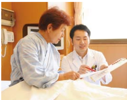
▲丁寧に患者さまにご説明いたします。

その後、無菌性と安全性を確保するためにガウンやマスクを着用し、安全キャビネットという装置を使って無菌調剤を行います。この時も薬剤師2名による二重チェックを行い、入念な確認を行っています。