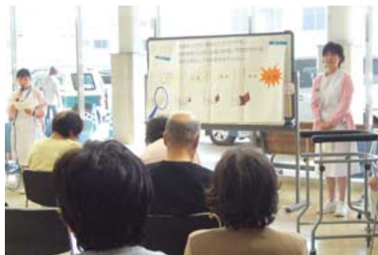
公開糖尿病教室の様子

看護師／足病変のメカニズムと糖尿病との関係・予防 理学療法士／靴・靴下の選び方、運動する時の姿勢 看護師／フットケア外来のPRと受診の手順