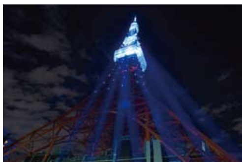
ブルーにライトアップされた東京タワー

当院でも、糖尿病療養指導士のメンバーが中心になって、いろんな活動をしています。その中の一つとして毎週水曜日14時から、糖尿病教室を開いています。興味のある方は気軽に参加してください。いろんなスタッフの力となった取り組みが、多くの糖尿病患者さんに喜んでもらえることを確信しています。