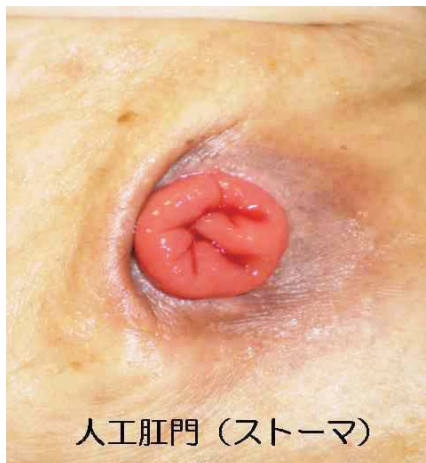
人工肛門 (ストーマ)

尿病に合併する下腿潰瘍や糖尿病性壊疽の増加を認めており、これらに関する皮膚ケアについての相談にも関わっています。その他、手術後の創や瘻孔、胃瘻管理についても相談を受けています。 人工肛門の手術前ケアから社会復帰するまでの生活指導や、在宅になってからのライフスタイルに関する相談や援助を行います。