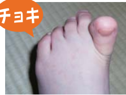
足の親指とほかの四指を交差します