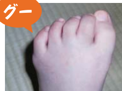
足の指全部をギュッと縮めます