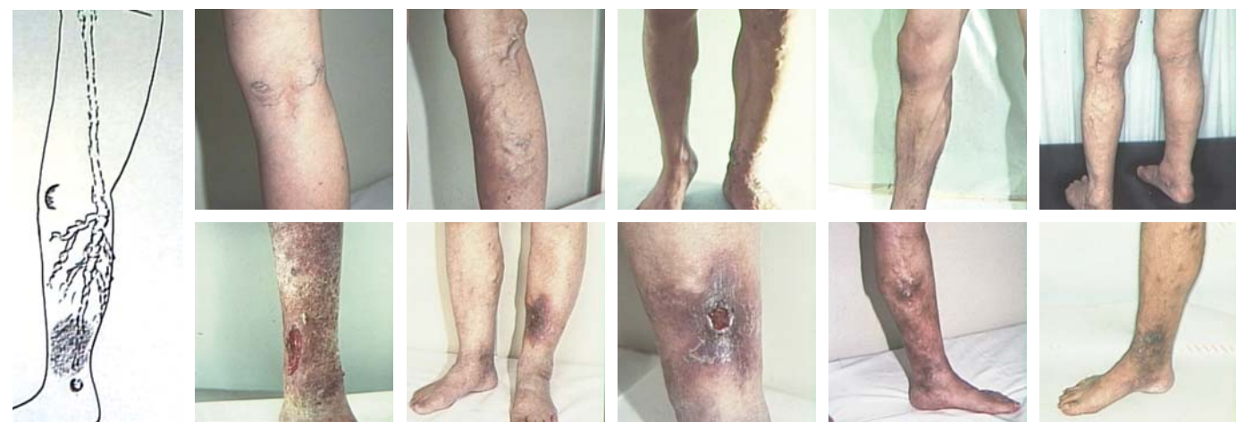
(次のページへ続く)

下肢静脈瘤の患者様は、一般的には若年者の方も多いですが多くは50歳以上の高齢の方に多く、かつ女性の頻度が男性の倍ほど多いのが特徴です。また最近、欧米の生活様式が普及し、椅子やソファーなどにじっと長時間座っていることも多くなり、下肢にうっ血をきたしやすい生活環境にあり、患者様は増える傾向にあります。自覚症状としては、足や脚がだるい、痛い、むくむ、重い、色が悪い(黒っぽい)、皮膚が痒い、湿疹様、夜間におこるかぶらはきの(こむら返り)など、静脈中に血の塊(血栓)ができて痛む、赤くなる、圧痛がある、等等です。他覚的所見としては、皮膚の表面から見える下肢の静脈の拡張(瘤状に膨らむ部分もある)、下腿の湿疹様の皮膚変化、下腿以下の皮膚の色素沈着(黒っぽくなる)、下腿や足の腫脹(はれ)、下腿の下の方に生じる難治の皮膚潰瘍などです。